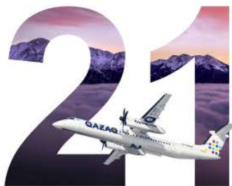
Внутренних направлений по Казахстану