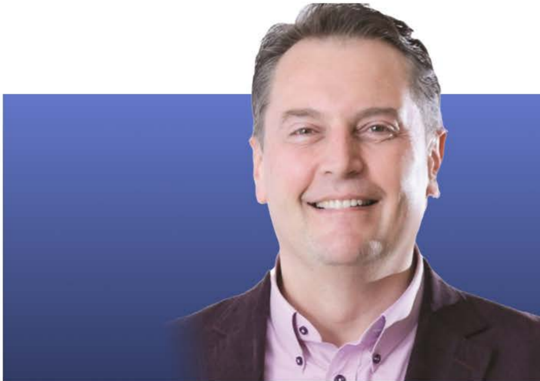
Эндрю Коэн Директорлар Кеңесінің Төрағасы

Мен сіздерге «QAZAQ AIR» әуекомпаниясының 2023 жылға арналған жылдық есебін қуана ұсынамын. Бұл жыл компаниямыз үшін маңызды жетістіктер мен өзгерістер жылы болды.