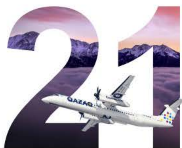
Қазақстан бойынша ішкі бағыттар